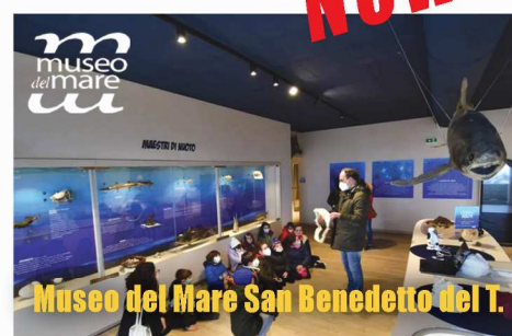
Museo del Mare San Benedetto del T.