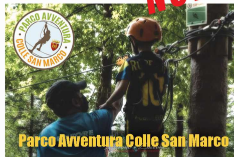
Parco Avventura Colle San Marco